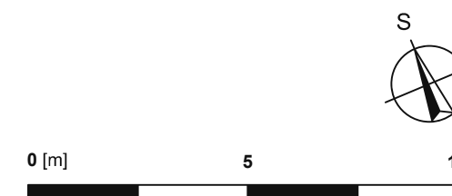
Schematický půdorys 1.NP