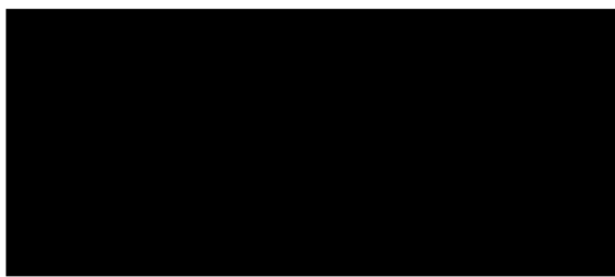
odběratel razítko a podpis zástupce