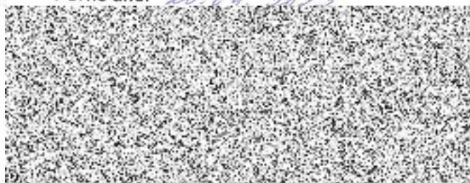
Příkazce: Jiří Ides