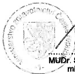
MUDr. Svatopluk Němeček, MBA ministr zdravotnictví