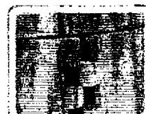
Kompostér lze otevřít ze všech stran díky praktickému řešení