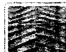
Žebrování zabraňuje ucpávání odpadem