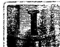
Pojistky zabraňují otevření větry