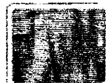
Větrací otvory celý kompostér provzdušňují