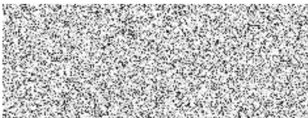
Forestlaan, s.r.o. jednatel