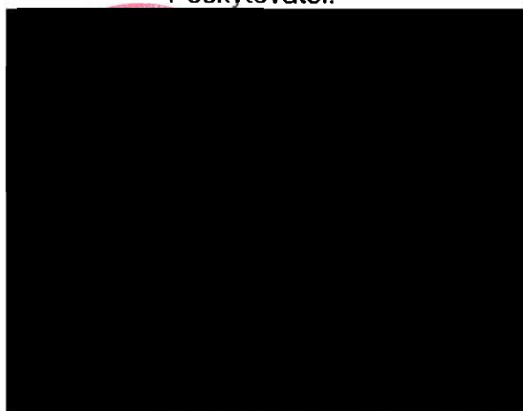
..... Martin Záhoř náměstek hejtmána pro oblast sociálních věcí