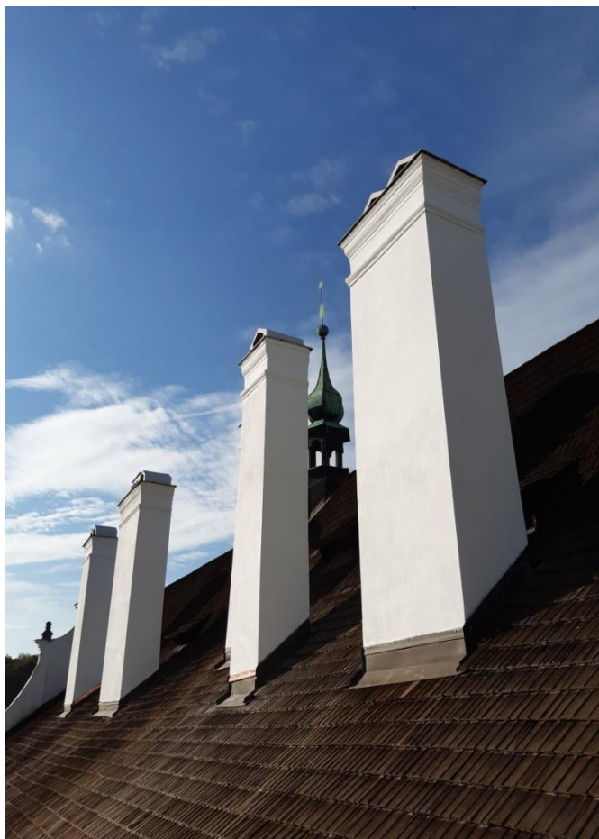
Příloha: Pohled na šindelovou střechu budovy muzea, Horní 152