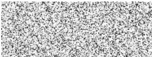
SIBATECH CZ spol. s r.o. pronajímatel