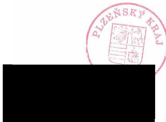
Martin Záhoř náměstek hejtmána pro oblast sociálních věcí