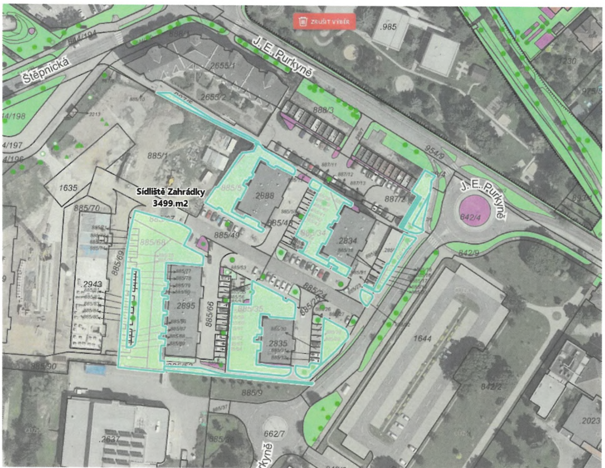
Veřejná zakázka malého rozsahu na služby: Údržba vybraných travnatých ploch na území města Uherské Hradiště