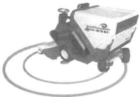
Nulový poloměr otáčení