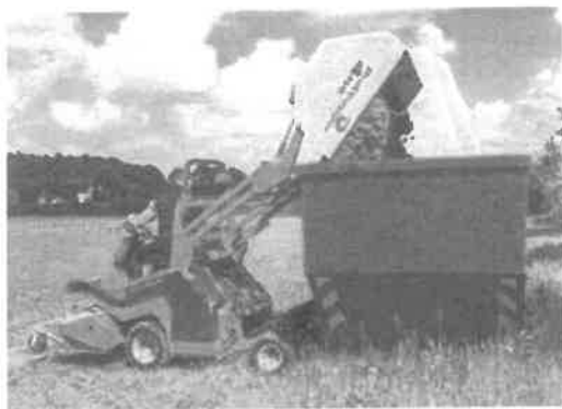
Vyklápění do 2,1 metru