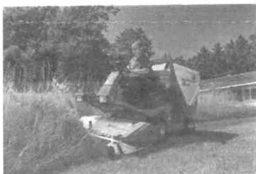
Sečení vysoké trávy