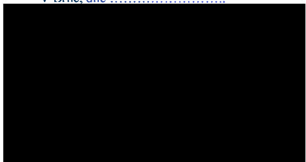
výkonný ředitel VOV, s.m.o.