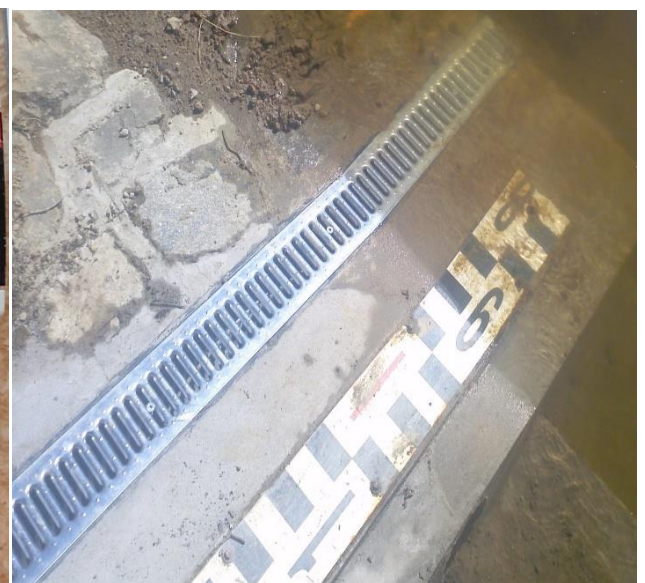
obr. 3 Vzor rozebratelné chráničky