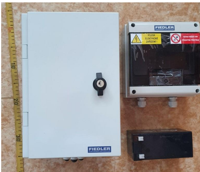
obr. 2 Stanice s příslušenstvím