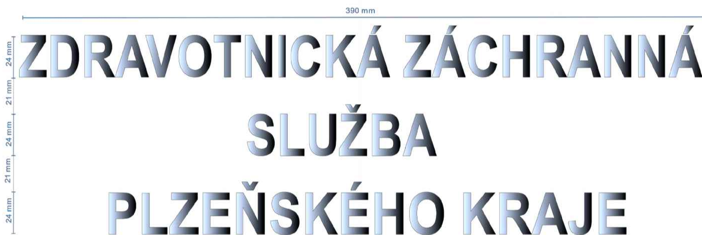
Obr. č. 3 Retroreflexní nápis tištěný na zadní díl provedený kvalitním tepelným transférem. (Uvedený rozměr je pro pánskou kalkulační velikost)