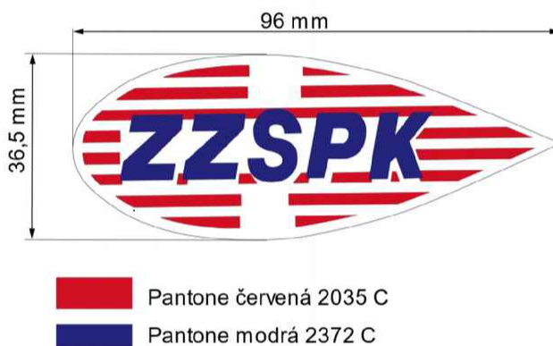
Obr. č. 1 Vytkávaná nášivka ZZSPK

Vytkávaná nášivka našitá na ramenní části levého rukávu polokošile (mezi vrcholem rukávové hlavice a spodním krajem rukávu (viz. Popis níže)