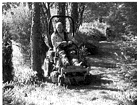
Sekačka SCAG Z-Cat se záběrem 91 cm při práci ve velmi členitém a těžce dostupném místě.

Pojezdové hnací kolo na každé straně využívá samostatně axiální čerpadlo a hydromotor, které jsou odděleně řízeny pákami z místa obsluhy. Stroj se otočí okolo vlastní osy - dojde tak k nulovému poloměru otáčení. Díky této koncepci jsou stroje SCAG extrémně obratné, rychlé a přesné, což představuje vysokou efektivitu a nejen to, rovněž zábavu při práci, při které docílíte ještě lepší výsledky. Proti klasickým travním traktorům je SCAG s „0“ poloměrem otáčení až třikrát rychlejší při stejném záběru žacího ústrojí.