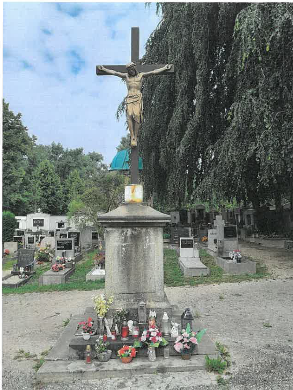
Příloha č. 2 fotografie kříže