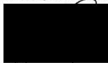
Pavel Hroch člen rady kraje za dárce