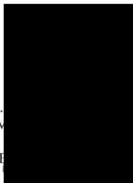
Doc. M. ...