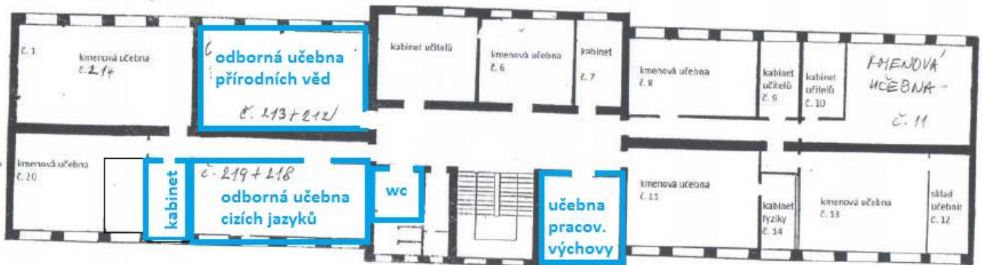
Schéma č. 1 – úpravy místností v 2.NP