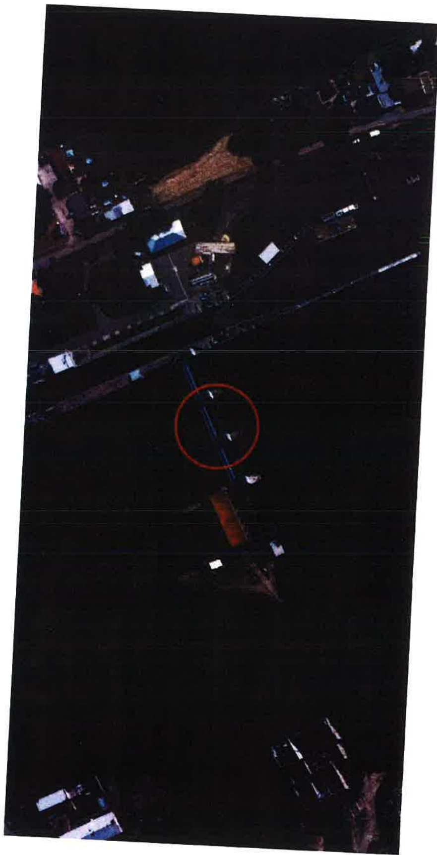
VD Klavary, oprava spodní stavby jezu, potápěčské práce