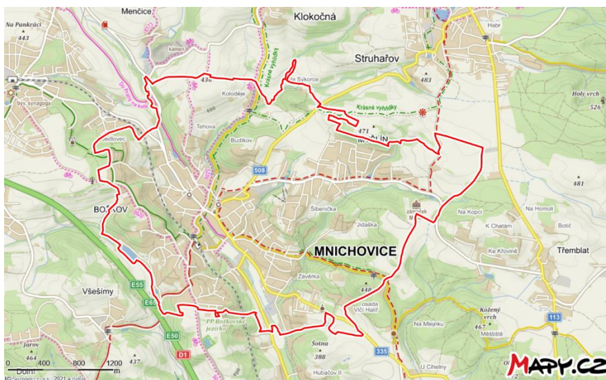
Mapa města Mnichovice, zdroj: Mapy.cz, 2021.

Město Mnichovice a jeho 3 950 obyvatel obsluhují 3 autobusové (489, 490 a 495) a 2 železniční linky (S9 a R49). Město má 3 místní části: Božkov (cca 700 obyvatel), Mnichovice (cca 3000 obyvatel) a Myšlín (cca 250 obyvatel). Váha významnosti linek je nejprve rozdělena podle počtu obyvatel v místních částech: Božkov 0,18; Mnichovice 0,76 a Myšlín 0,06.