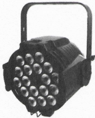
LED REKLEKTOR RGBWA+UV