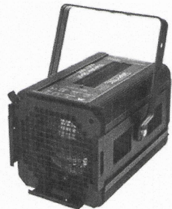
VARYTEC Theater Spot

NEJSME PLÁTCI DPH. DODACÍ LHŮTA 2 TÝDNY. PLATNOST CENOVÉ NABÍDKY 03/2022. CENY JSOU VZTAŽENY PRO KOMPONENTY VE VELKOSKLADECH V ČR, CENY NA NOVÉ DOVOZY BUDOU AKTUALIZOVÁNY DLE KURZU CZK!!!