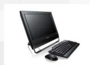
Výpočetní a kancelářská technika