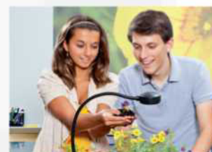
Projektory a vizualizéry