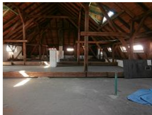
Foto č. 1,2,3 –západní část půdy určená pro zřízení nové půdní vestavby