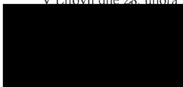
starosta města Litovel