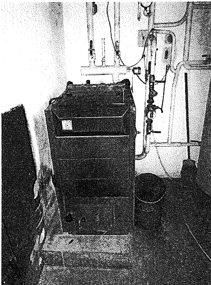
Obr. 1. DAKON DOR-32-pohled zepředu

Fotodokumentace stávajícího kotle na tuhá paliva. Milan Kučrhalt, Nová Cerekev 262, Nová Cerekev 394 15