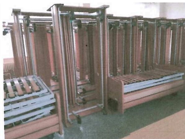
Obrázek 2: Část uskladněných lůžek

Dne 2.12.2020 byla provedena prohlídka lůžek, které jsou umístěny v místnosti budovy Vančurova 17. Lůžka jsou rozebraná a uskladněná. Rok pořízení je 2003 a 2004; s ohledem na stáří jsou ve velmi dobrém stavu. Jednotlivá lůžka jsou opatřena inventarizačním číslem kterým budou v posudku označena.