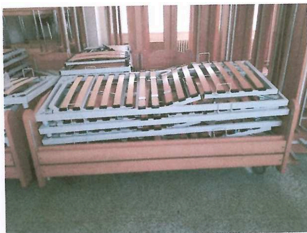
Obrázek 1: Část uskladněných lůžek