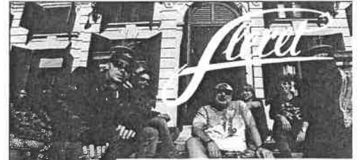
AKTUÁLNÍ FOTO JINÁ JEN S ODSOUHLASENÍM

FOTOGRAFIE, RL, PROMO TEXT ODESLÁNY EMAILEM DNE: