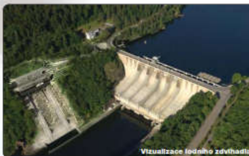
Vizualizace lodního zdvihadla