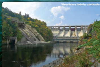
Vizualizace lodního zdvihadla