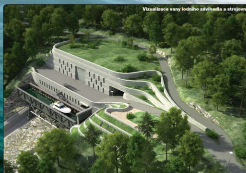
Vizualizace vany lodního zdvihadla a strojovny