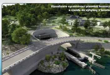
Vizualizace vyrovnávací plovací komory a vjezdu do výtahů v tunelu