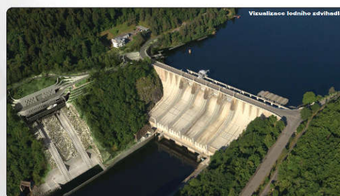
Vizualizace lodního zdvihadla