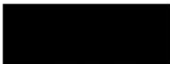
Jiří Zajac starosta městské části Praha 14