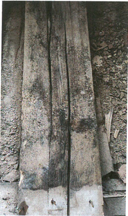
Detail zasaženého dřeva