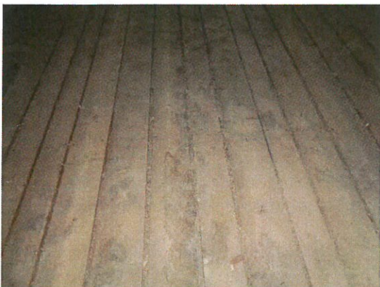
Detail zasaženého dřeva