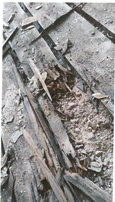
Detail zasaženého dřeva