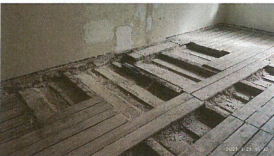
Průběh sanace zasažených prostor