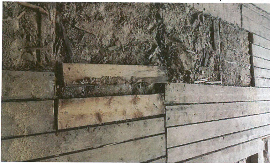
Zasažené podlahové polštáře