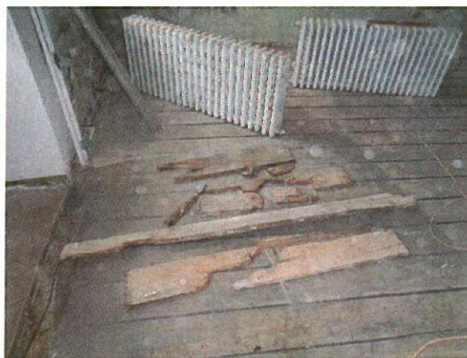
Detail zasaženého dřeva