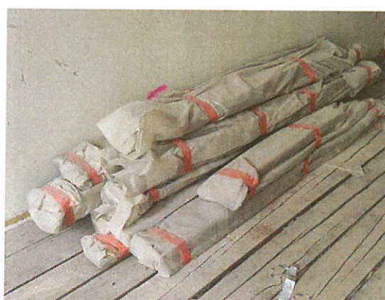
Skladování uzavřeného dřeva před odnesením