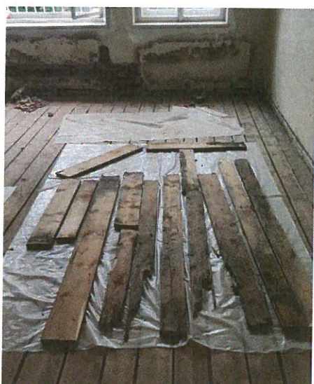
Příprava zasaženého dřeva před uložením do pytlů