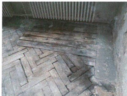
Detail zasaženého dřeva