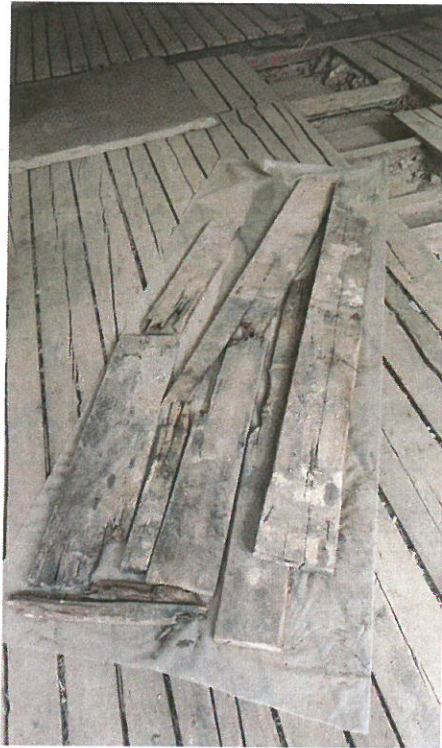
Příprava dřeva na balení