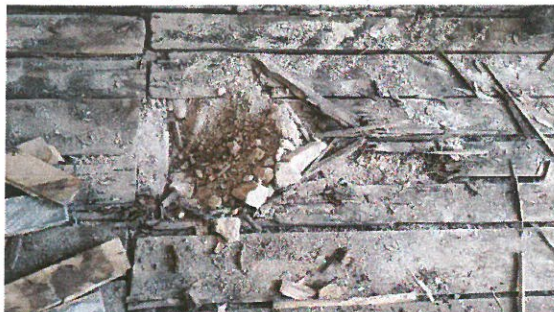
Detail zasaženého dřeva