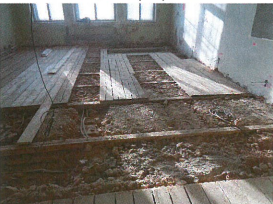
Postupná demontáž podlahy a odtěžování zásypu