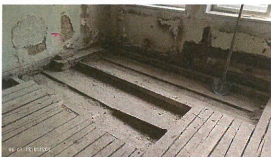
Čištění zasažených prostor