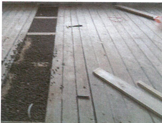
Pokládka nové konstrukce podlahy