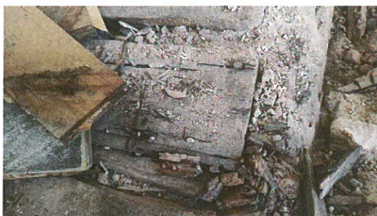
Detail zasaženého dřeva