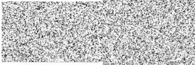
Michal Boudný starosta města Slavkov u Brna