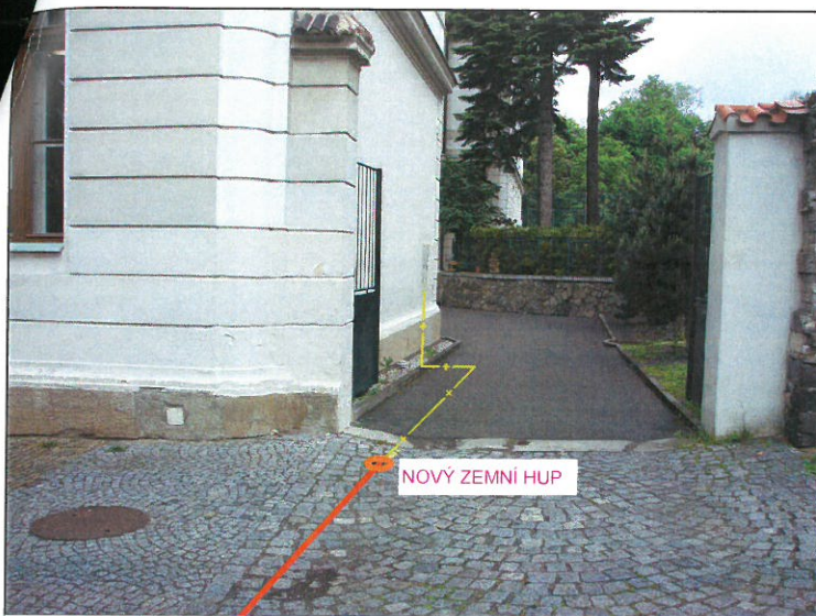
NOVÝ ZEMNÍ HUP

ul. Jiráskovy sady, Ivana Olbrachta, Fibichova, Gen. R. Tesaříka, Tyršova