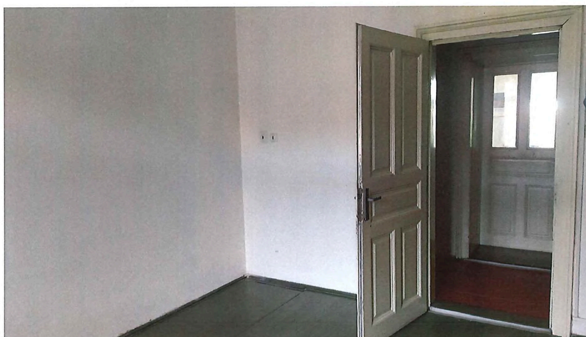
Pohled na místnost, malování nátěry