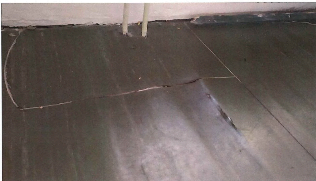
Uvolněná prkna na podlaze