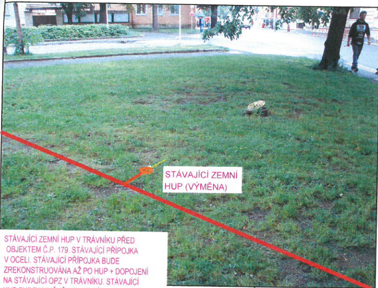
STÁVAJÍCÍ ZEMNÍ HUP (VÝMĚNA)

ul. Jiráskovy sady, Ivana Olbrachta, Fibichova, Gen. R. Tesaříka, Tyršova