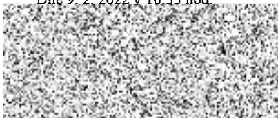
ředitel pro retailový obchod