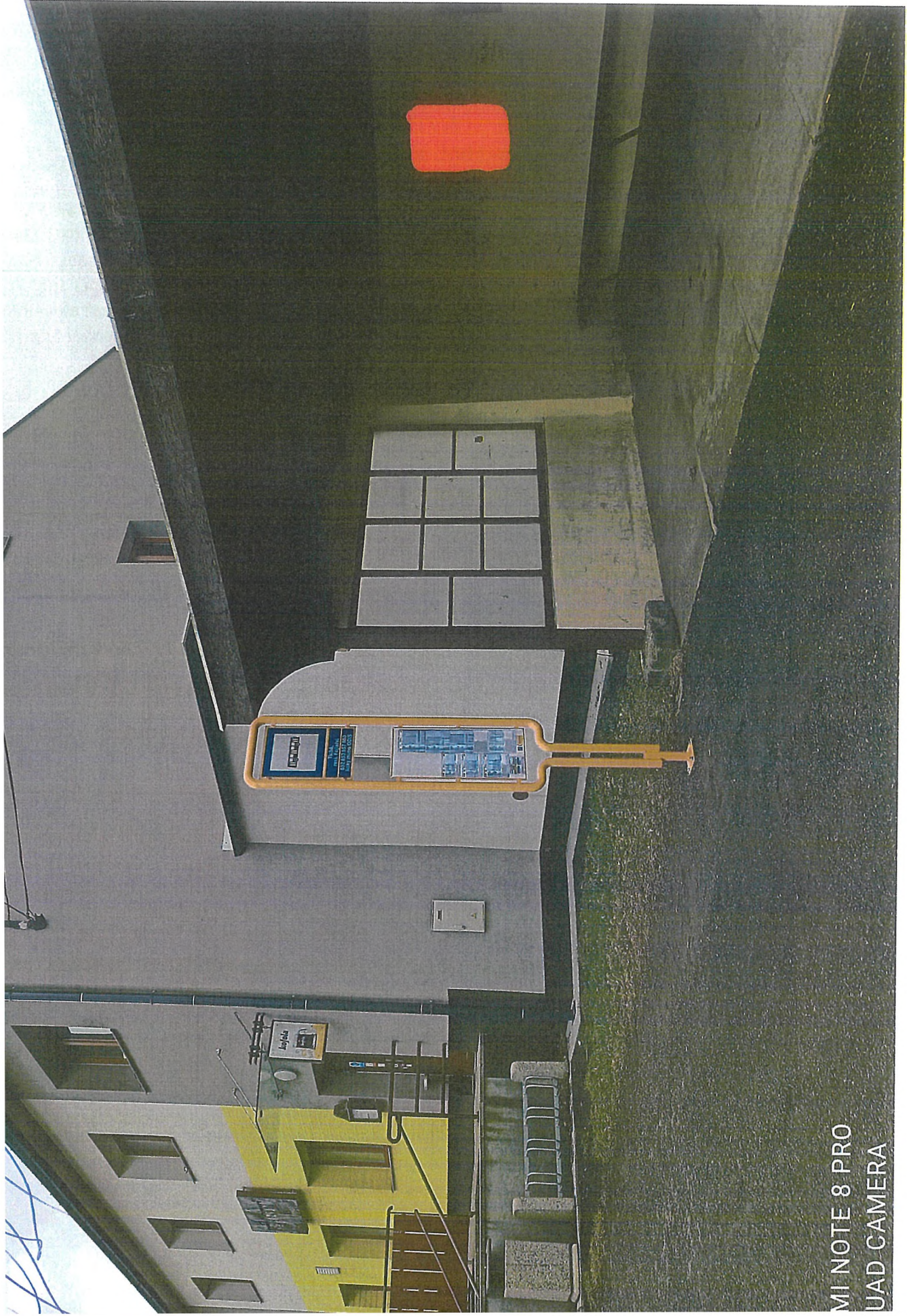
MI NOTE 8 PRO UAD CAMERA