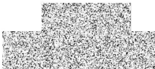
Jméno a podpis ředitele školy