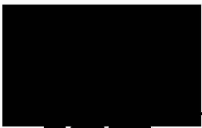
generální ředitel VoZP ČR Objednatel