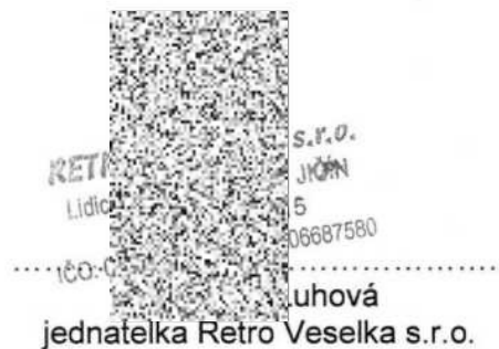
..... jednatelka Retro Veselka s.r.o.