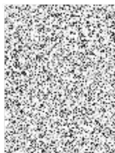
jednatelka společnosti MERIDIE s.r.o.

MERIDIE s.r.o. Sídlištěm 293/1 36 00 BRNO CZ60748681 ngerova