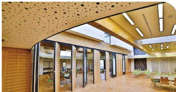
MOBILNÍ POSUVNÉ STĚNY