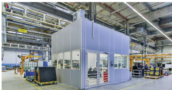
VESTAVBY DO HAL