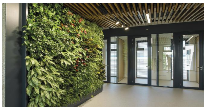
ZELENÉ STĚNY A MECHOVÉ OBRAZY