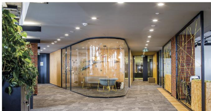
PROSKLENÉ INTERIÉROVÉ PŘÍČKY