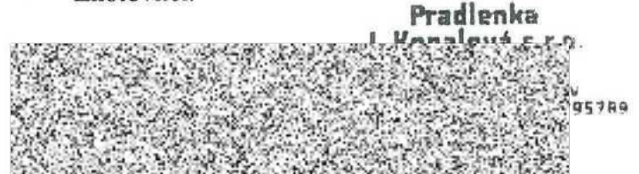
Iva Kopalová, jednatelka