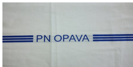
značení ložního prádla