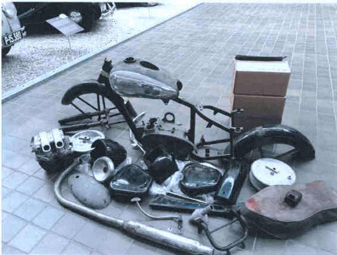
Současný stav motocyklu

Restaurátorský záměr pro motocykl Jawa 500 OHC typ 15/02, výrobní číslo rámu 005289