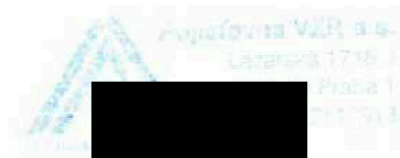
Místopředsedkyně představenstva za pojišťovnu