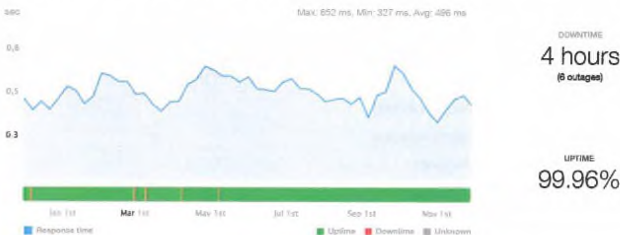
Obrázek 1 - dostupnost aplikace v roce 2020

V roce 2021 byla dostupnost aplikace 99.96 % (viz následující graf)