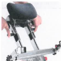
Ovládací prvky pro připevnění a odpojení řídítek a bezpečnostní prvky, umístěné na řídítkách schodolezu