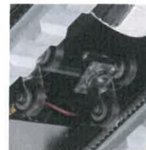
Elektricky pohaněný kolečkový systém