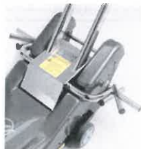
skládací spodní úchyty pro připevnění vozíku